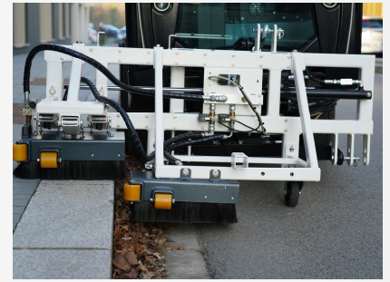
Rampe Dyn' 40x40