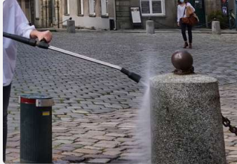
Lavage Haute Pression